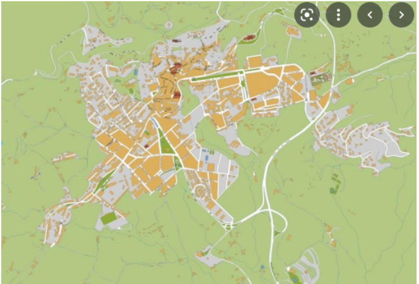
Mapa de Berga